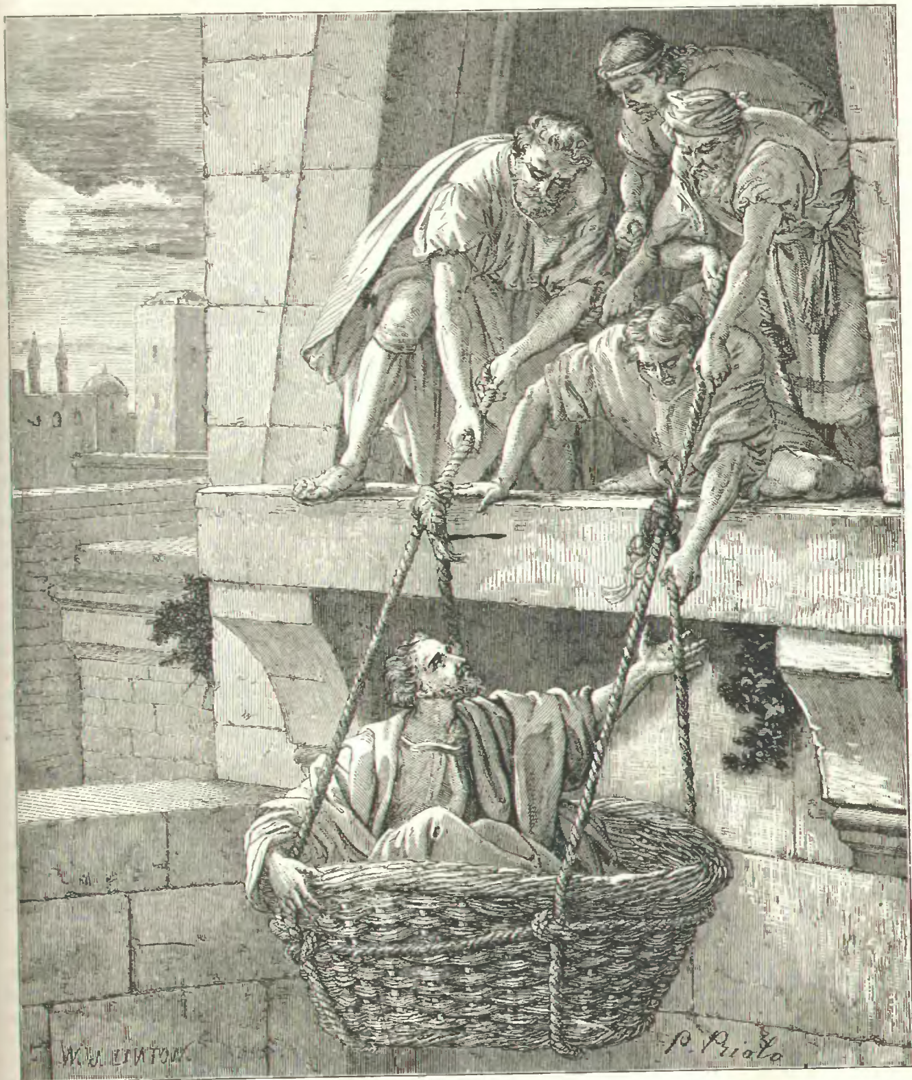
БѢГСТВО СВ. АПОСТОЛА ПАВЛА ИЗЪ ДАМАСКА. (ДѢЯН. XI. 23—25. — Къ стр. 142.)