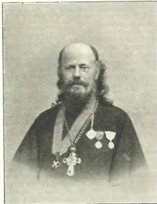
ПРОТОІЕРЕЙ А. И. СПЕРАНСКІЙ. (Скончался 27 января 1906 года).